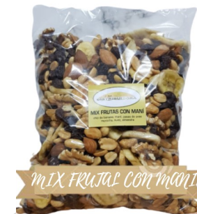
MIX FRUTAS CON MANI