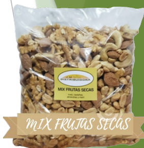
MIX FRUTAS SECAS