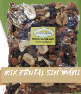
MIX FRUTAL SIN MANI