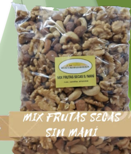
MIX FRUTAS SECAS SIN MANI